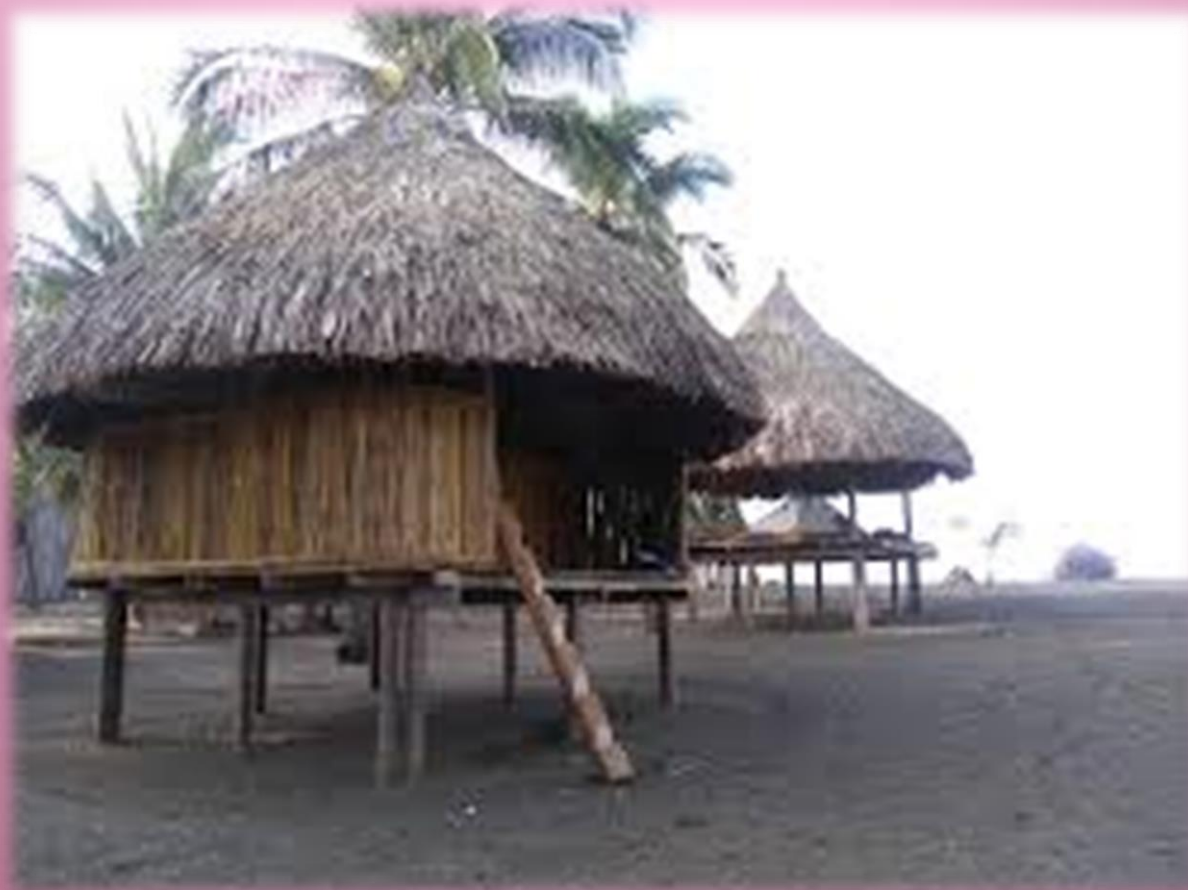
Vivienda De los Emberá Wounaan